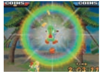
☒ DS Diddy Kong erdrückt sich auf dem Hindernisparcours 100 goldene Münzen, Knuddeldino Yoshi haut den Ball via Supermove krachend in den Korb (rechts).