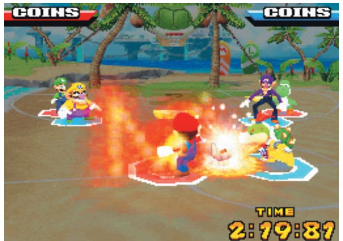
☒ DS Feuer frei für Mario: Tippt zweimal ein 'M' auf den Schirm und der Klempner setzt zum Superspecial an - wenn ihm nicht Bowser jr. noch in die Quere kommt.