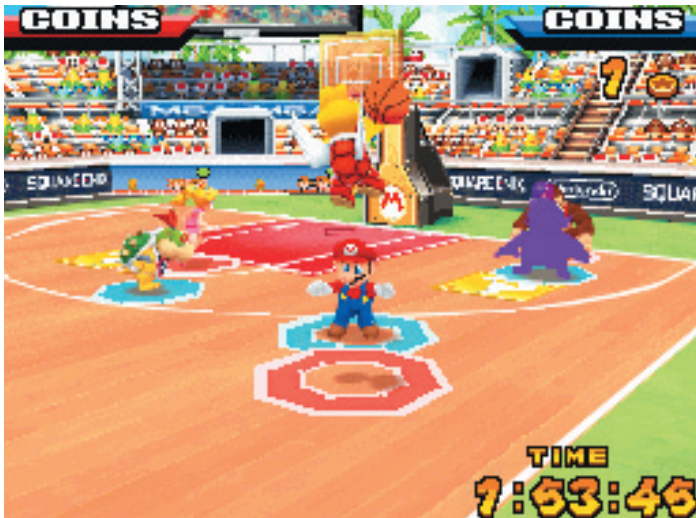
☒ DS Schön bunt: Viele Plätze orientieren sich an typischen Mario-Themen. Ihr tretet am sonnigen Strand, in Bowsers Schloss oder inmitten Donkeys Dschungel an.